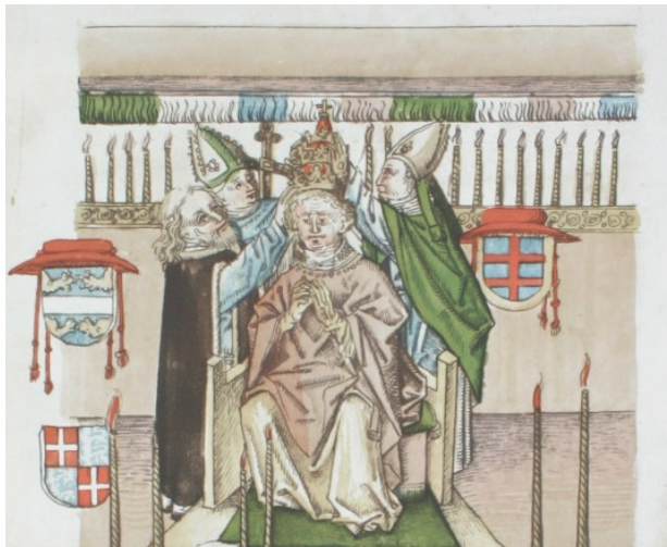
Ill. : Ulrich Richental, Chronik des Konstanzer Konzils, Aug. Anton Sorg, Augsburg 1483, le couronnement de Martin V, après les deux dépositions-renoncations de 1417